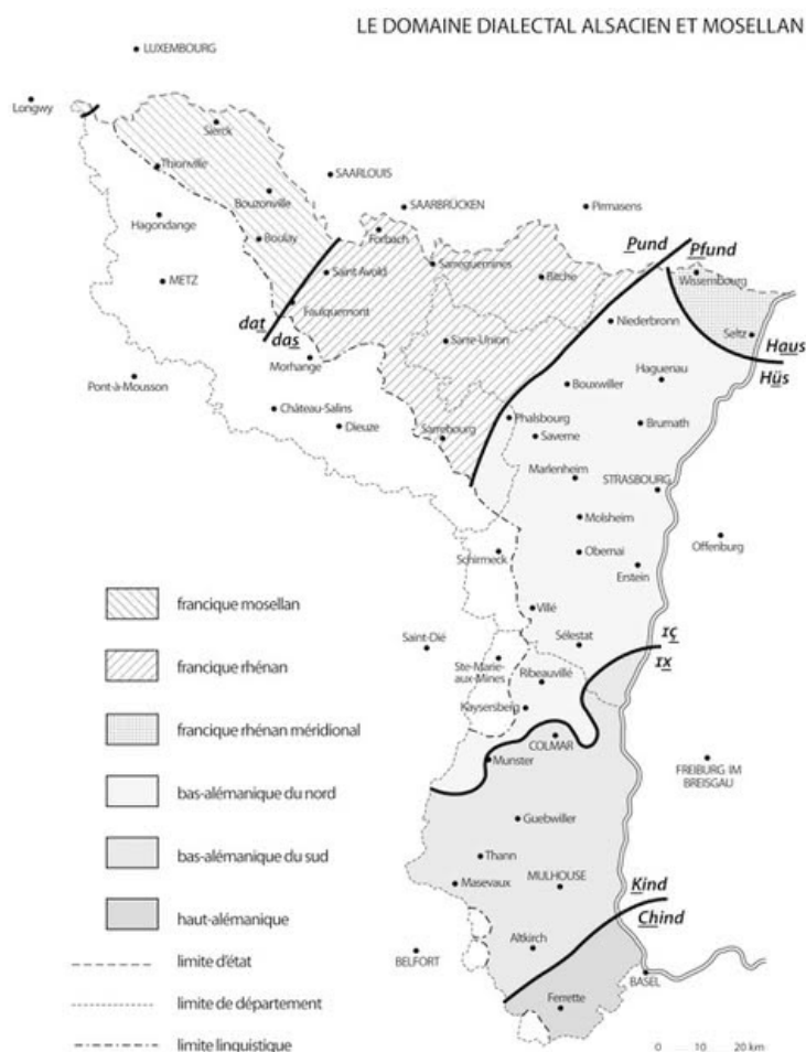
Figure 1 : Carte du domaine dialectal alsacien et mosellan

Réalisée par Anne Horrenberger pour l'université de Strasbourg, 2017.