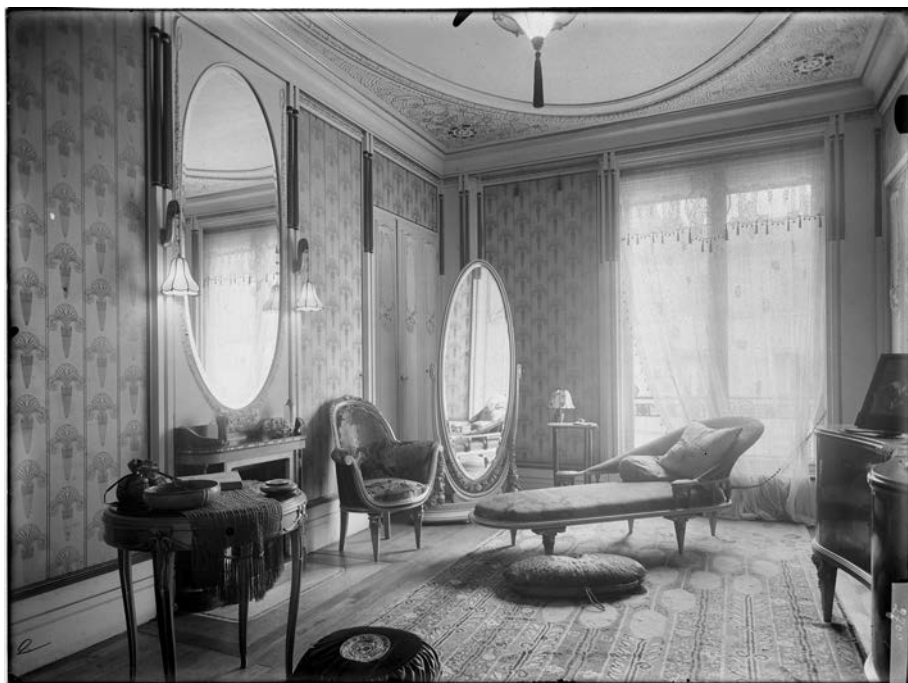
Fig. 8 : ibid. , boudoir.