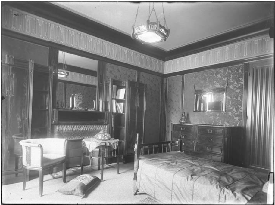
Fig. 6 : ibid. , chambre à coucher.