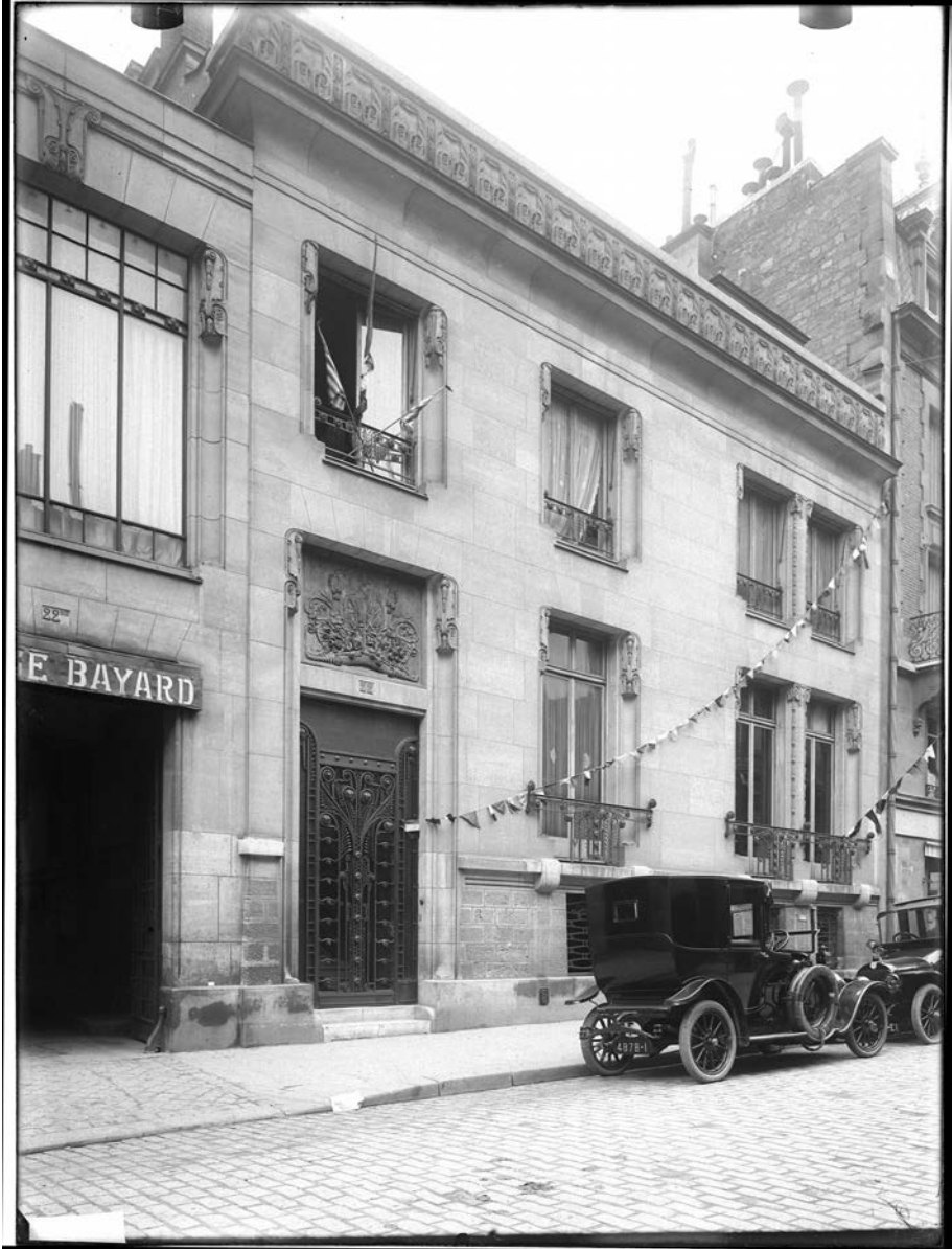
Fig. 2 : Maurice Dufrene, façade de l'hôtel particulier du 22, rue Bayard à Paris. Photographie de Charles Lansiaux, 27 novembre 1918. Paris, Département d'Histoire de l'Architecture et de l'Archéologie de Paris (DHAAAP).