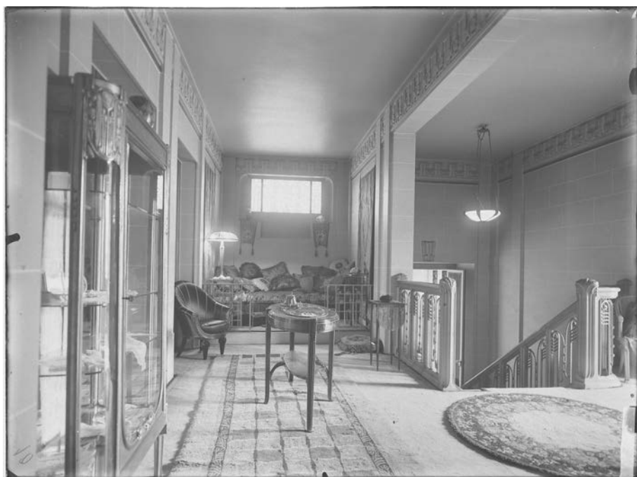
Fig. 5 : ibid. , antichambre.