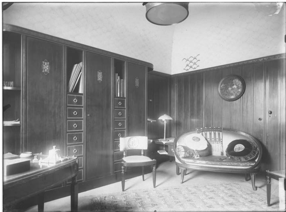
Fig. 7 : ibid. , cabinet de travail.