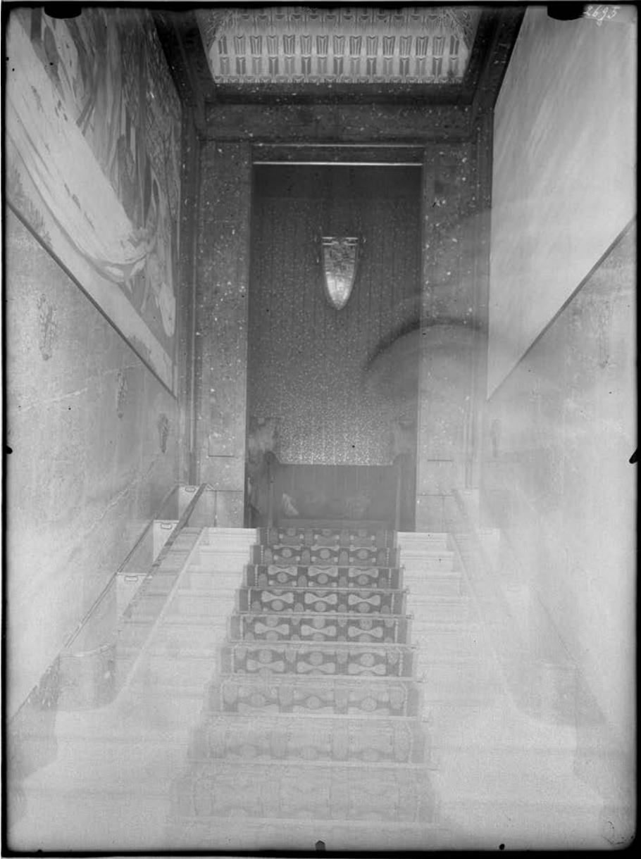
Fig. 3 : ibid. , escalier