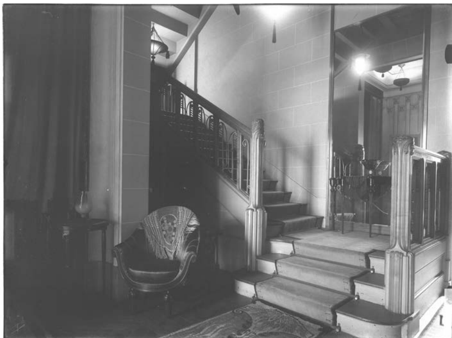
Fig. 4 : ibid. , départ d'escalier.