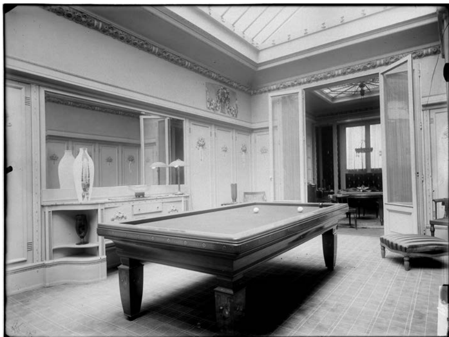
Fig. 9 : ibid. , salle de billard.